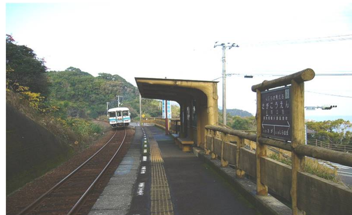
土佐くろしお鉄道「佐賀公園駅」から徒歩2分